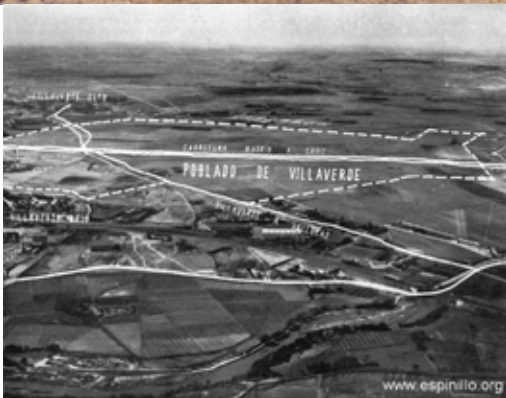
(derecha) Villaverde desde el Este, en primer término río Manzanares y huertas, 1950.