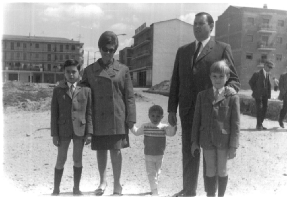
(de arriba a abajo, izquierda a derecha): La carnicería del barrio. / Familia en el Cruce de Villaverde, Calle J. J. M. Seco, Plaza Chozas de Canales en mayo de 1968. / La churrería del barrio. / Jóvenes de Villaverde en los años 70.