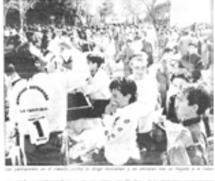
(arriba) Movimiento por la dignidad del sur. (izquierda) Diarior16: "Vecinos de Villaverde protestaron ayer contra la droga". (abajo) Plaza de las sufragistas antes de su remodelación.

ASOCIACION DE VECINOS ENFERRADOS EN ALCALDIA Los vecindarios de Villaverde se movieron ayer para protestar contra la droga en un ambiente festivo como banner de protesta contra los problemas de drogas que padece la zona Sur de Madrid. Los autores de la idea se quejaron de falta de apoyo por parte de la Junta de Distrito.