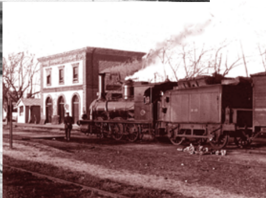
(de arriba a abajo, izquierda a derecha): 1936 Estación de Villaverde Bajo en la guerra. / Talleres de Villaverde Bajo y nudo ferroviario Villaverde, 1924. / Primeros ferrocarriles a su paso por Villaverde Bajo. / Edificio viejo. Estación de Villaverde Bajo, 1926. / 1936. Reconquista de Villaverde Bajo por las fuerzas leales, a la derecha se aprecia edificio insudtrial, Talleres Vers o MZA.