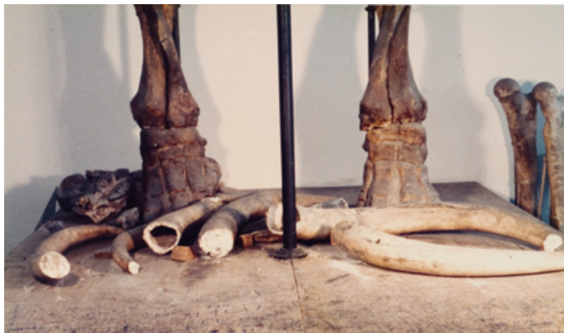
(arriba) Restos del Mamut de Villaverde Bajo localizado en el Museo de Ciencias Naturales.