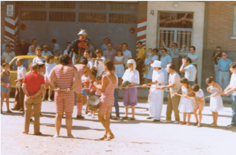
Una actividad de las Fiestas del barrio.

A través de este libro queremos presentar algunos de los hitos más destacados para la asociación de vecinos y rendir homenaje a todas aquellas personas que de un modo u otro y con mayor o menor intensidad, han hecho de Villaverde Bajo y de su asociación, un espacio digno del que sentirnos orgullosos y orgullosas.